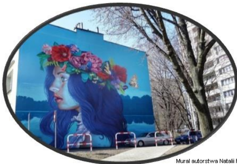
Mural autorstwa Natalii Rak

II Liceum Ogólnokształcące im. A. Asnyka w Bielsku-Białej, ul. Jutrzenki 13 przy współpracy Miejskiego Zarządu Oświaty